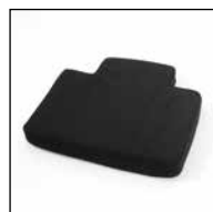
Kissen für Funktionsplatte