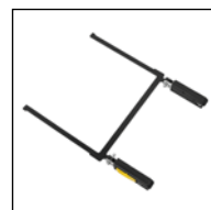
Seatfix-Adapter hinter dem Sitz