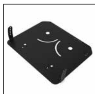
Neigungsfunktion 10° (0° / 2,5° / 5° / 7,5° / 10°)