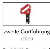
zweite Gurtführung, oben