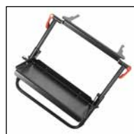
Fußstütze, abklappbar (Höhe und Winkel verstellbar)