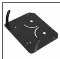
Neigungsfunktion 20° (10° / 12,5° / 15° / 17,5° / 20°)