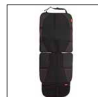
Autositz-Schutz mit Rücken