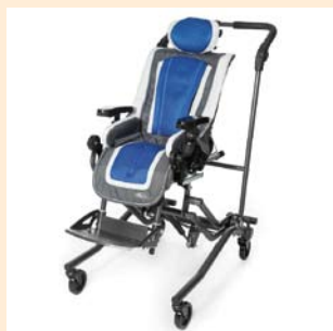
Mit ThevoSeat , dem Bewegungssitz mit MiS Micro-Stimulation® und Zubehör Armlehnen