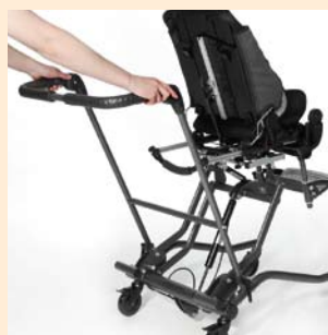
Schiebegriff individuell an Betreuer anpassbar