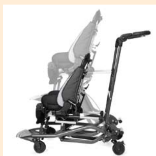
Großzügige Höhenverstellung von 21 bis 60 cm (Höhe des Sitzadapters)