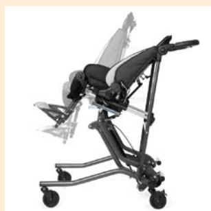
Sitzkantelung bequem stufenlos winkelverstellbar von -7° bis +31°