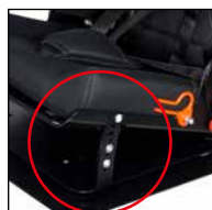
Erweiterung Neigungsfunktion 12,5 - 20° (12,5° / 15° / 17,5° / 20°)