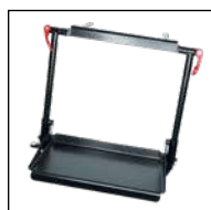
Fußstütze, abklappbar (Höhe und Winkel verstellbar)