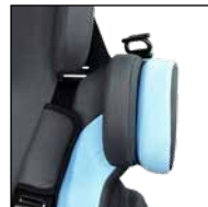
Schulterpolster (zur Verringerung der Schulterbreite)