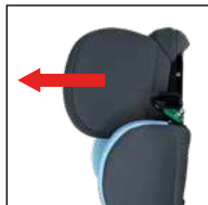
Kopfstütze, Zusatzverlängerung (Seiten)