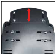
Zusatzverlängerung (Kopfbereich Höhe)