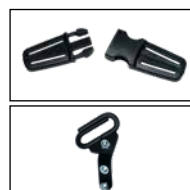
Gurtverbinder für Schultergurte (oben), zweite Gurtführung, oben (unten)