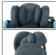
Kopf-Zusatzpolster (oben), Anbringung des Kissens (unten)