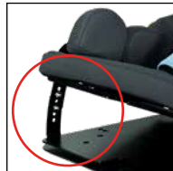
Neigungsfunktion 12,5° - 20° (12,5° / 15° / 17,5° / 20°)