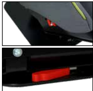
Drehfunktion (oben), Auslöser für Dreh- funktion (unten)

**** Thoraxpelotten starr und Thoraxpelotten schwenkbar sind nicht gleichzeitig einsetzbar