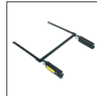
Seatfix-Adapter hinter dem Sitz