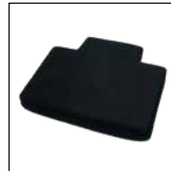
Kissen für Funktionsplatte