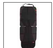
Autositz-Schutz mit Rücken