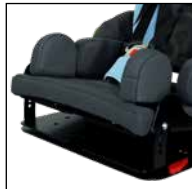
Neigungsfunktion 10° (0° / 2,5° / 5° / 7,5° / 10°)