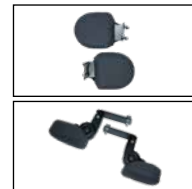
Thoraxpelotten, starr (oben), Thoraxpelotten, schwenkbar (unten)