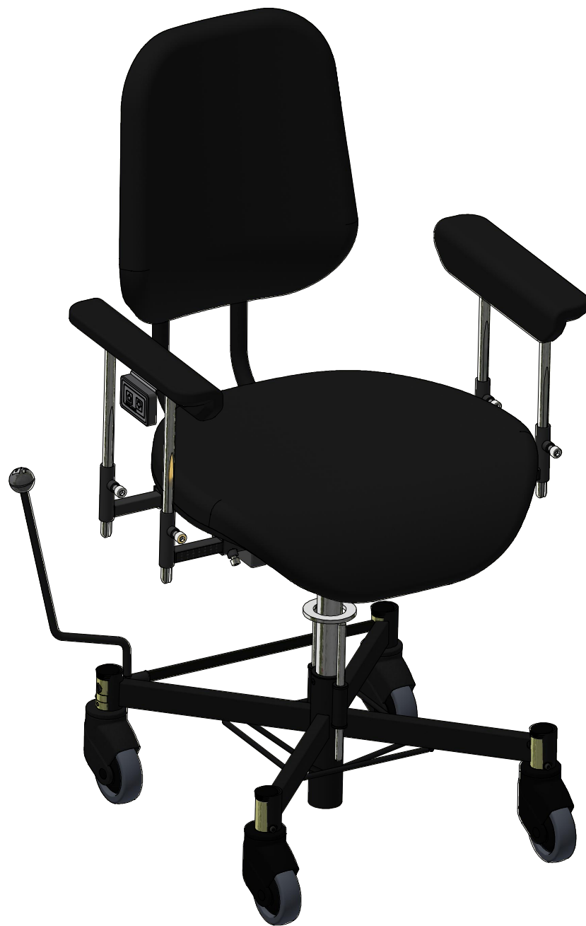
VELA Tango 300E