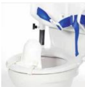
Universalspritzschutz (Befestigung direkt an der Toilettenbrille)

Produktbeschreibung Die Basis-Unterstützung für die Toilette Artikelnummer 9800021570000 Artikelbezeichnung Universalspritzschutz (Bene) Identifikation 420371-2-1 + 420371-2-1 + 429115-9-1 / Lager 5 (0,10) Empfohlener VK-Preis 203,00 EUR zzgl. MwSt. Preis Werksverkauf 60,00 EUR zzgl. MwSt.